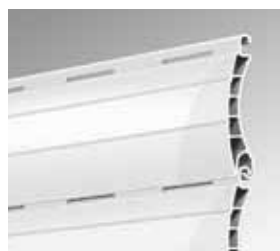
KUNSTSTOFF MINI 38 Einfach und ideal verwendbar für Neubau- und Objektbereiche