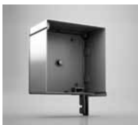
90°-SCHRÄGE Geradlinig mit klarer Kontur