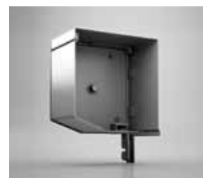
20°-SCHRÄGE Bewährte Blende mit klaren Linien