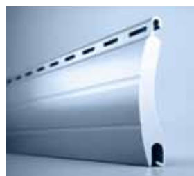
MINI 41 Für größere Flächen. Robust und gut.