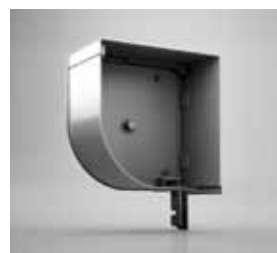
VIERTELRUND Passgenaue Laibungsmontage