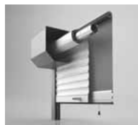
INTEGRIERTES INSEK- TENSCHUTZROLLO für alle Varianten erhältlich.