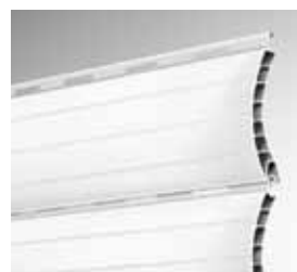
KUNSTSTOFF MAXI 52 Einfach und ideal verwendbar für Neubau- und Objektbereiche