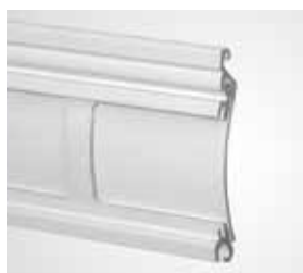
BIROLL Jalousierbarer Rollladen. Das Beste aus zwei Wel- ten. Mit Insektenschutz.