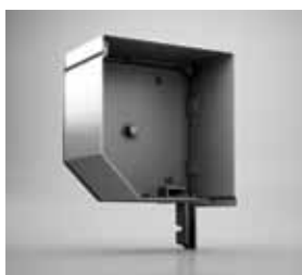
45°-SCHRÄGE Der Standard im Norden. Markante Optik mit einem Plus an Lichteinfall.

Mit der richtigen Farbe und Form, die Fassadenoptik aufwerten