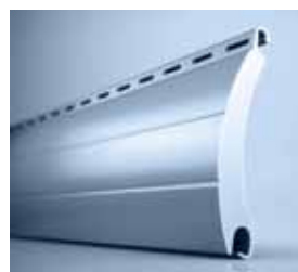
MAXI 54 Für den Neubau- oder Mauerkasten.