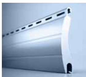
MINI 41 Für größere Flächen. Robust und gut.