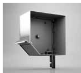
UNTERPUTZ BLENDE Verschiedenste Formen für den Neubau oder die Sanierung.