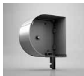
RUND Mit Rundoptik Akzente setzen