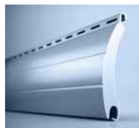
MAXI 54 Für den Neubau- oder Mauerkasten.