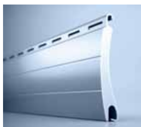
MINI 37 Viele Farben und kleiner Winkeldurchmesser